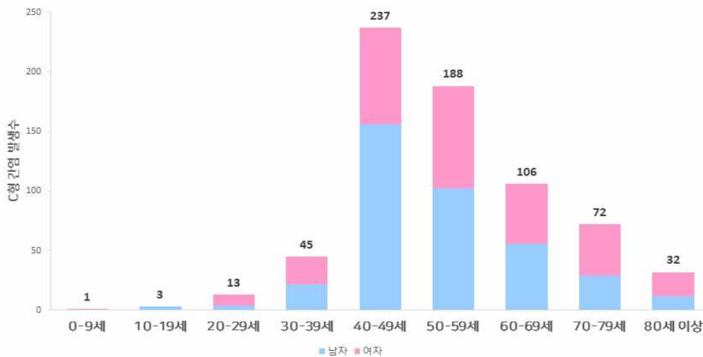
2017년도 인천광역시 군·구별 C형 간염 발생률