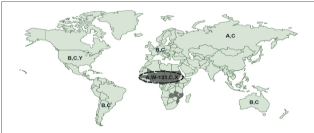
〈그림 3. 대륙별 수막구균 혈청군 분포〉