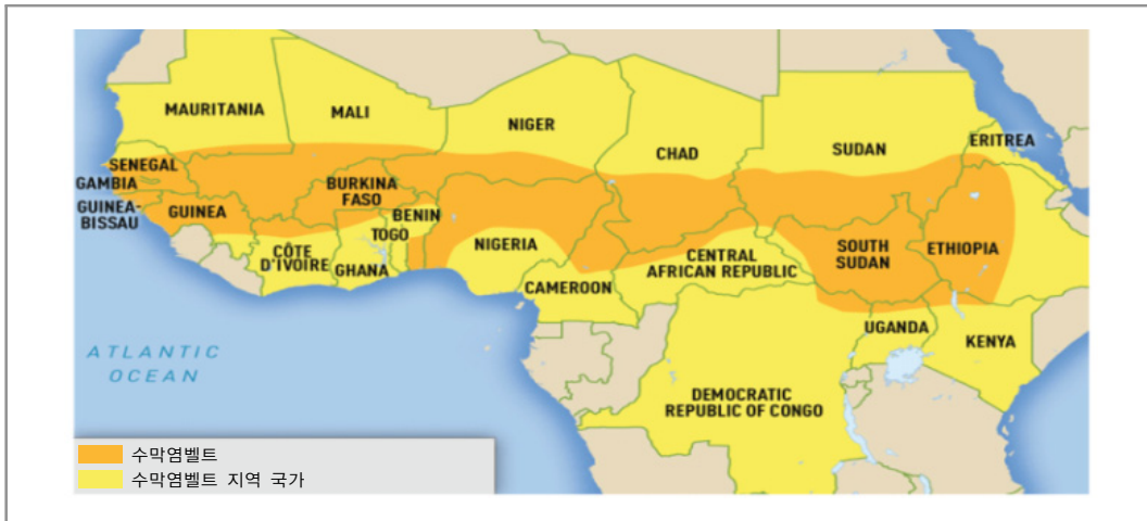
〈그림 2. 아프리카 수막염 벨트 및 해당 국가〉