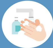
비누로 꼼꼼하게 손씻기