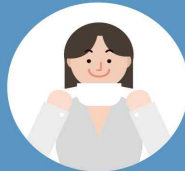
기침 등 호흡기 증상자는 반드시 마스크 착용하기