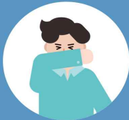
옷소매나 휴지로 가리고 기침하기