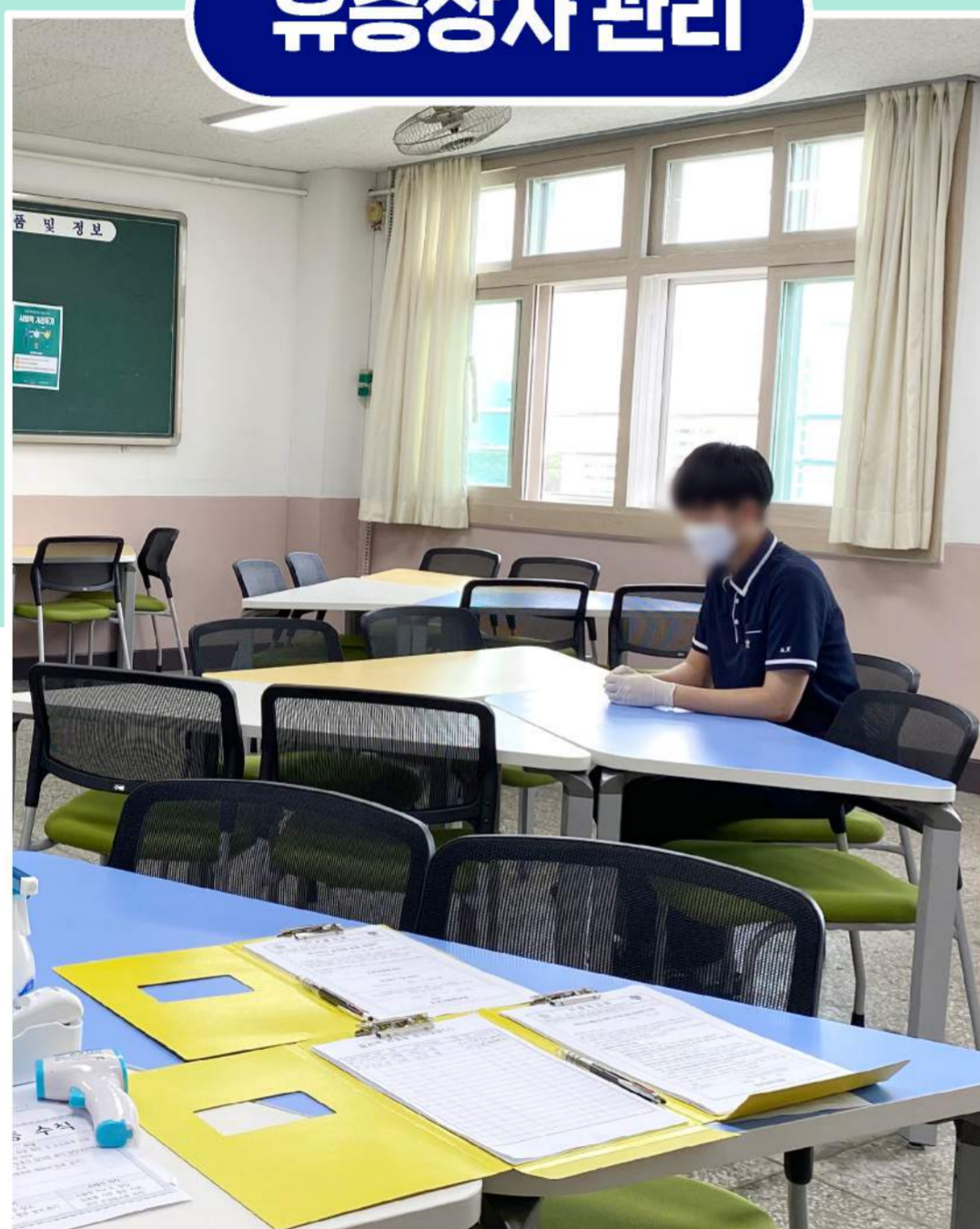
일시적 관찰실 이동