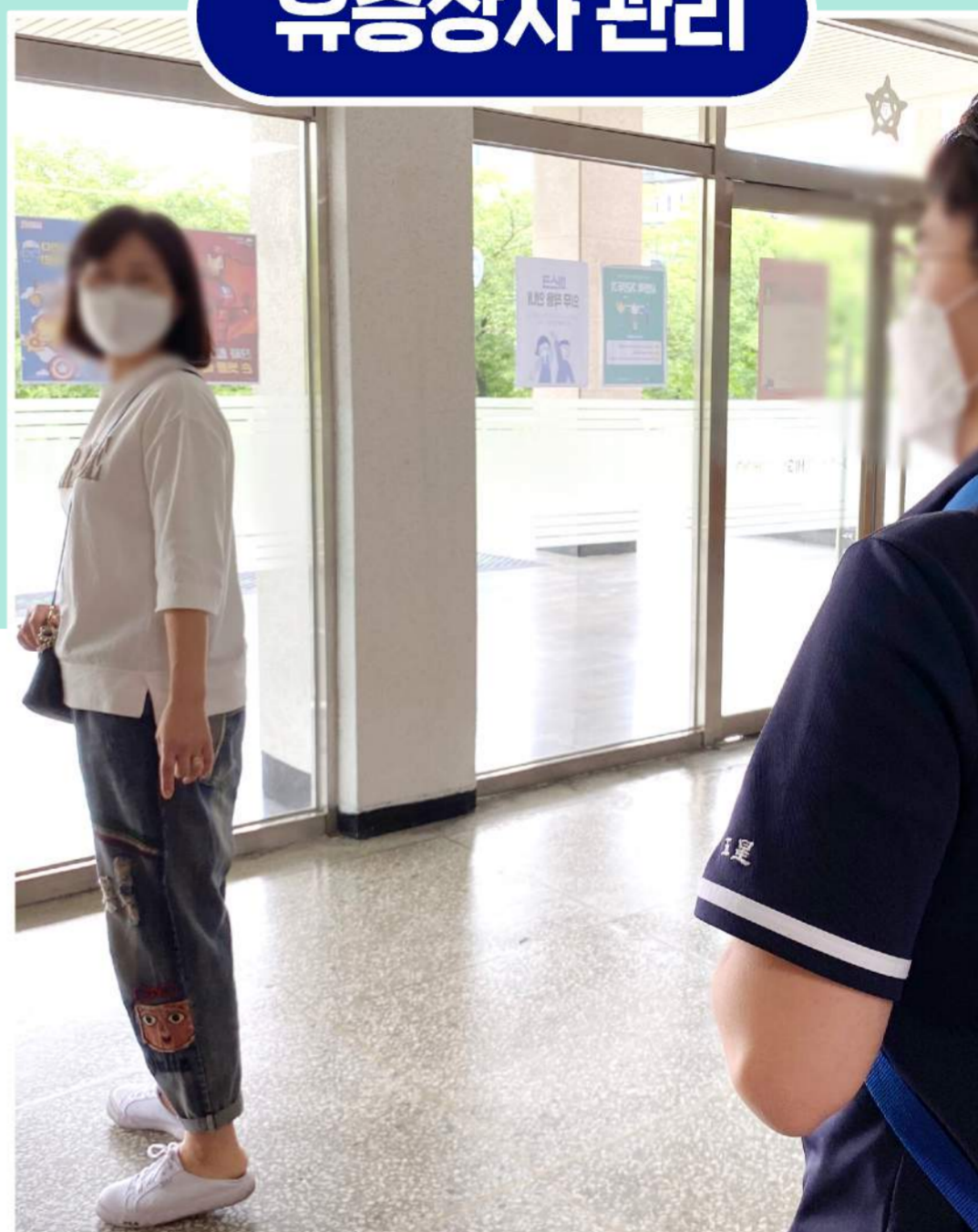
선별진료소 검사(부모 동반)