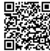
안드로이드 앱 설치