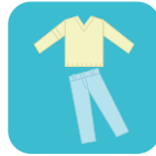
밝은색 긴팔, 긴바지